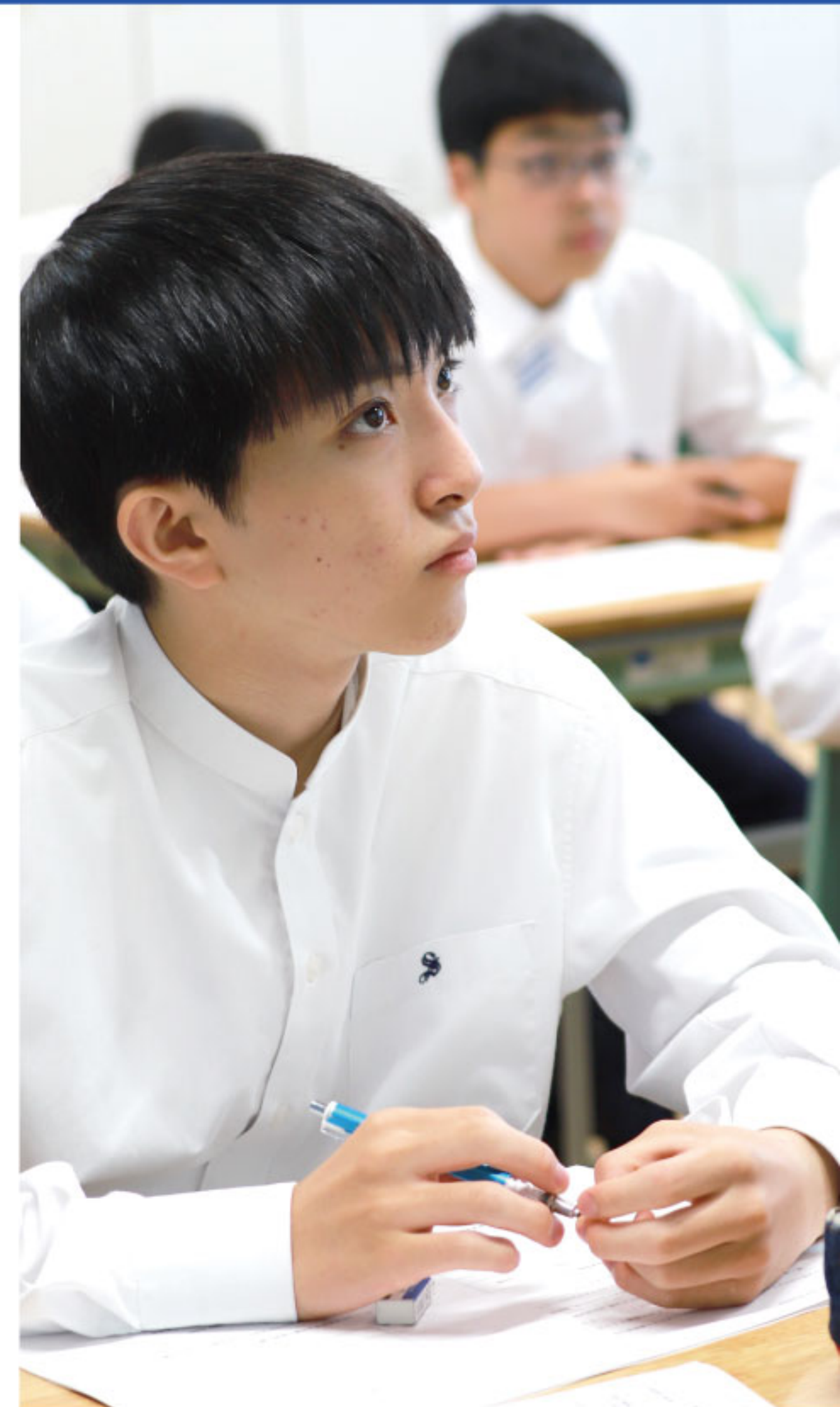
保健医療コース・みらい教育コース・情報コースへの協力:

令和7年度より開設(令和6年度入学生の2年進級時より選択可能)される情報コースでは、情報技術やプログラミング、Webデザイン、オンラインビジネスなどを学び、時代の先端で活躍する人材を育成します。